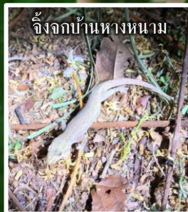
จิ้งจกบ้านทางหนาม