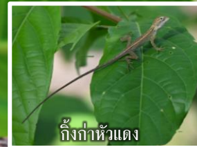
กิ้งก่าหัวแดง