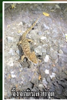
จิ้งจกดินลายจุด