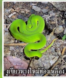
งูเขียวหางไหม้ท้องเหลือง