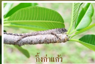
กิ้งก่าแก้ว

สัตว์เลื้อยคลาน (Reptiles) เป็นสัตว์มีกระดูกสันหลังประเภทหนึ่ง ลำตัวปกคลุมด้วยเกล็ดเพื่อป้องกันการระเหยของน้ำ ทำให้สามารถดำรงชีวิตในที่แห้งแล้งได้ แบ่งออกเป็น 4 กลุ่มคือ สัตว์เลื้อยคลานประเภทกิ้งก่าและงู สัตว์เลื้อยคลานประเภทเต่า สัตว์เลื้อยคลานประเภทจระเข้และแอลลิเกเตอร์ และ สัตว์เลื้อยคลานประเภทหัวทारा