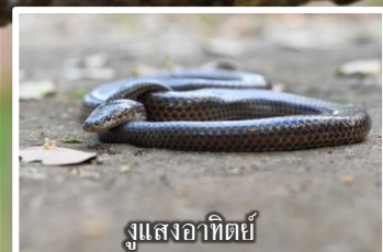
งูแสงอาทิตย์