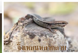
จิ้งเหลนหลาเกลาย